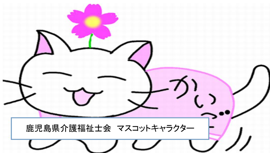
鹿児島県介護福祉士会 マスコットキャラクター